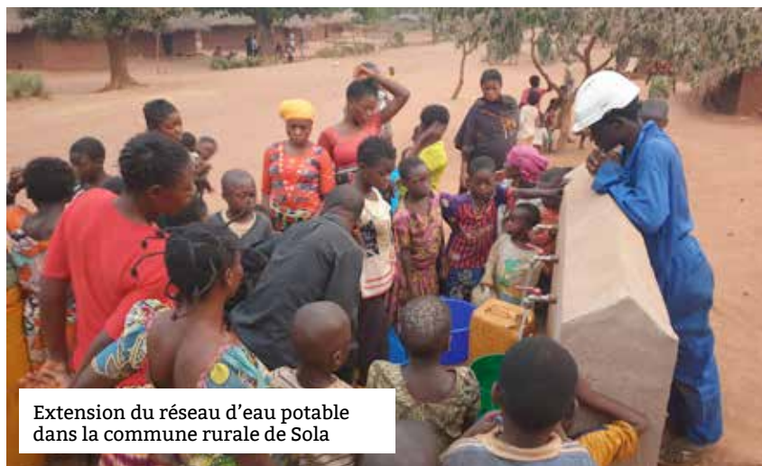
Extension du réseau d'eau potable dans la commune rurale de Sola

HAMAP-Humanitaire s'investit depuis plusieurs années dans des projets Eau, hygiène, assainissement au Burkina Faso, en Haïti et en République Démocratique du Congo (RDC), malgré les défis politiques et sécuritaires constants. Haïti est confrontée à de nombreuses crises politiques, sécuritaires et climatiques, le Burkina Faso est traversé par des conflits internes, tandis que la RDC fait face à des urgences sanitaires importantes.