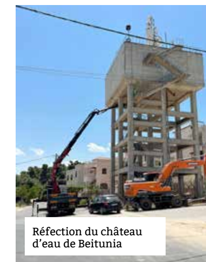
Réfection du château d'eau de Beitunia