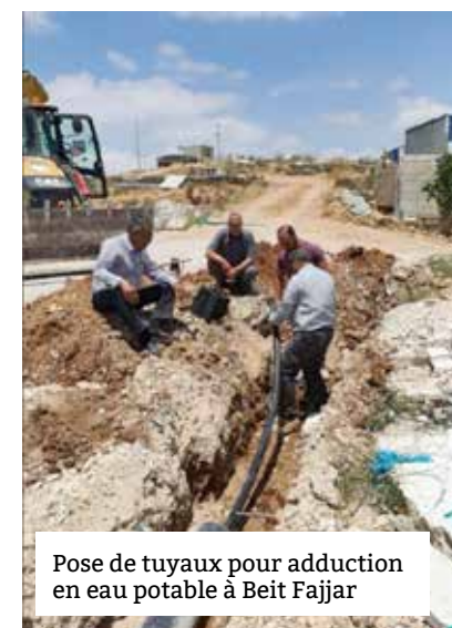
Pose de tuyaux pour adduction en eau potable à Beit Fajjar

Depuis 2018, la Commune de Lescar (14 000 habitants) est accompagnée par plusieurs syndicats d'eau et d'assainissement de son territoire, la Région Nouvelle-Aquitaine, l'Agence de l'Eau Adour Garonne et le ministère de l'Europe et des Affaires étrangères et HAMAP-Humanitaire, pour améliorer l'accès à l'eau potable et renforcer les infrastructures locales. En Palestine, la Municipalité de Beit Fajjar, la Palestinian Water Authority, et le Consulat Général de France à Jérusalem sont nos principaux partenaires.