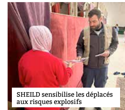
SHEILD sensibilise les déplacés aux risques explosifs

Les conditions de vie des Libanais se dégradent à un rythme alarmant. Alors que l'hiver arrive, de nombreuses familles vivent dans des logements temporaires et souvent endommagés par la guerre, pour beaucoup sans fenêtres. Les infrastructures sanitaires et hospitalières sont proches de l'effondrement. Si le cessez-le-feu ouvre la voie à un retour des déplacés, la destruction des habitations et des infrastructures, ainsi que la contamination aux engins explosifs des zones ciblées, empêche un retour digne et en sécurité des populations. Bien que la solidarité et la mobilisation libanaises et internationales soient remarquables, les ressources sont insuffisantes pour répondre à une crise de cette ampleur.