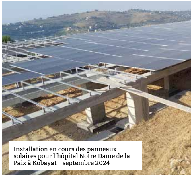
Installation en cours des panneaux solaires pour l'hôpital Notre Dame de la Paix à Kobayat – septembre 2024

Bien avant la guerre actuelle entre Israël et le Hezbollah au Liban, le Liban s'enfonçait depuis 2019 dans une crise politico-économique. Elle impactait déjà durement la stabilité et le fonctionnement de l'hôpital Notre Dame de la Paix à Kobayat, en raison de l'arrêt de fourniture de l'électricité publique, en faillite.