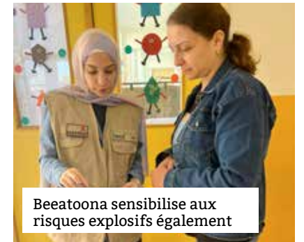
Beeatoona sensibilise aux risques explosifs également

Les conditions de vie des Libanais se dégradent à un rythme alarmant. Alors que l'hiver arrive, de nombreuses familles vivent dans des logements temporaires et souvent endommagés par la guerre, pour beaucoup sans fenêtres. Les infrastructures sanitaires et hospitalières sont proches de l'effondrement. Si le cessez-le-feu ouvre la voie à un retour des déplacés, la destruction des habitations et des infrastructures, ainsi que la contamination aux engins explosifs des zones ciblées, empêche un retour digne et en sécurité des populations. Bien que la solidarité et la mobilisation libanaises et internationales soient remarquables, les ressources sont insuffisantes pour répondre à une crise de cette ampleur.