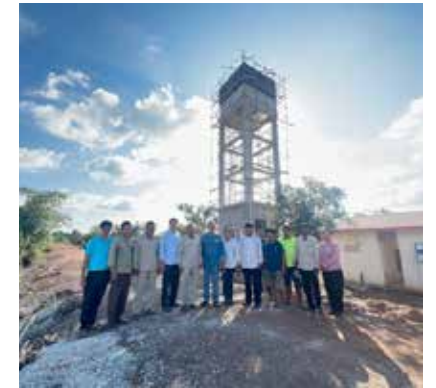
Equipe RWC et autorités locales. Suivi de projets dans le bassin du Stung Sen

de cette ONG, font de ce partenariat une garantie pour la qualité de nos interventions dans le pays. Au total, six projets ont été réalisés ou sont en cours dans trois communes du bassin du fleuve Stung Sen. Ces initiatives visent à renforcer l'accès à l'eau et à l'hygiène, tout en améliorant la qualité des services pour les habitants. Elles sont menées en coordination avec la stratégie de gestion intégrée des ressources en eau (GIRE), portée par les agences de l'eau Rhin Meuse et Loire Bretagne, ainsi que par les autorités ministérielles cambodgiennes.