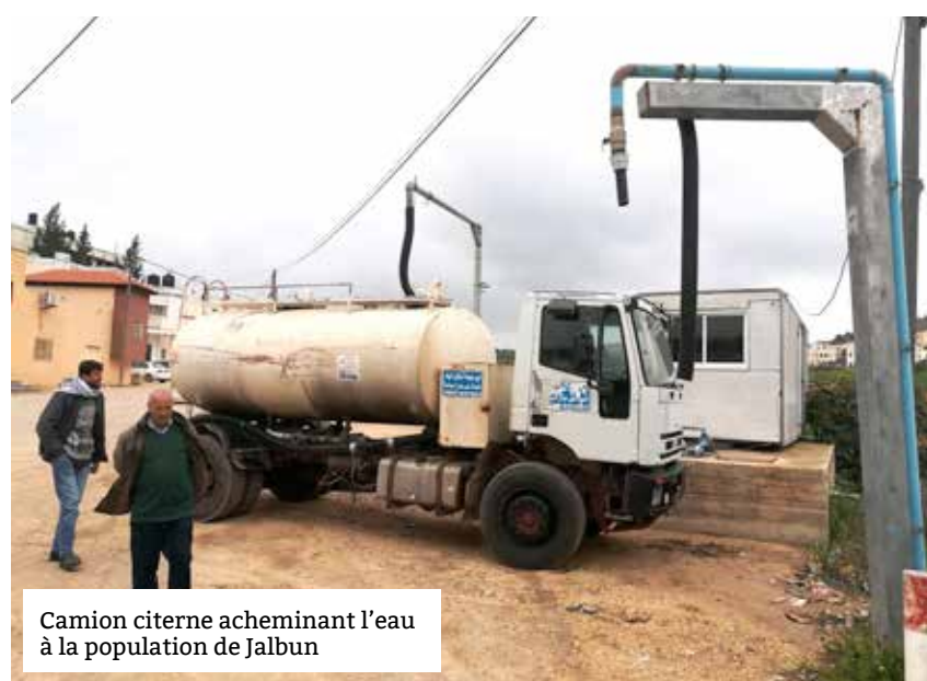
Camion citerne acheminant l'eau à la population de Jalbun

Mais la guerre a tout bouleversé. Les travaux du château d'eau ont été brutalement interrompus et le projet a été suspendu avant même son aboutissement. L'entreprise en charge des travaux n'a pas pu continuer et, pire encore, le matériel a été réquisitionné par les autorités israéliennes. Malgré ces obstacles, les bailleurs ont su montrer une souplesse remarquable pour s'adapter et rester au côté des partenaires locaux. Il est envisagé de réorienter les efforts de la coopération vers l'achèvement de la construction du château d'eau et la pose des premiers tronçons de réseau pour répondre à l'urgence.