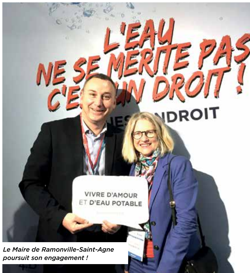
Le Maire de Ramonville-Saint-Agne poursuit son engagement !