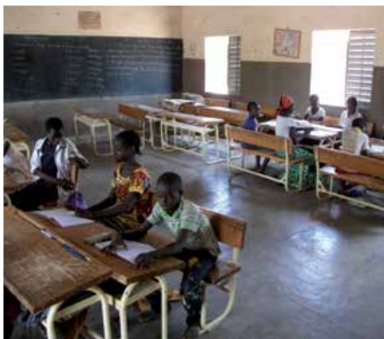
ONG ASD-B, BURKINA FASO