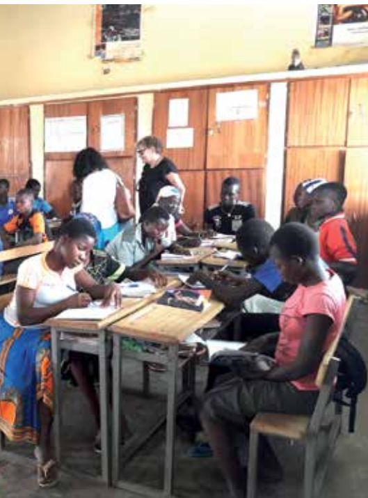
Mission éducation au Burkina Faso.