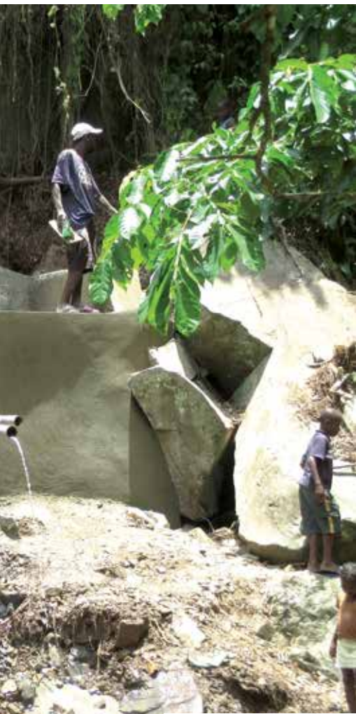
Protection d'une source d'eau en Haïti.

avec ANARUZ dont la définition est "la terre, les hommes, la langue". Le partenariat avec la Fondation ARTELIA consiste en un bénévolat de compétences. Nous amenons notre expérience, notre savoir-faire et notre expertise au bénéfice d'une action ou d'un projet qui rejoint les objectifs et l'état d'esprit de la Fondation ARTELIA. C'est un vrai bénévolat car les missions sont réalisées sur nos temps de congés ; la Fondation prend en charge les voyages, le matériel utile à la mission (comme une tablette tactile GPS, pour la mission avec ANARUZ). Ce partenariat a pu se dérouler dans des conditions optimales au vu de l'implication des différents acteurs et des liens de confiance qui ont pu être tissés."