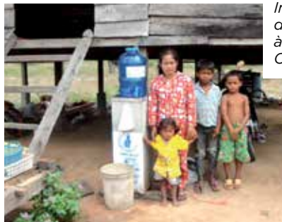
Installation de filtres à eau au Cambodge.