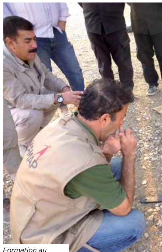
Formation au déminage en Irak.

région centre du pays, au sein de la commune d'Ayos. Ce projet traite une problématique qui constitue un enjeu de santé publique au sein du pays. L'équipe se rendra sur place tout au long du projet et assurera l'équipement du centre hospitalier d'Ayos et des 7 centres de santé intégrés en matériel adapté aux besoins de la population locale. L'équipe formera aussi le personnel médical à l'utilisation du matériel et au dépistage de la maladie.